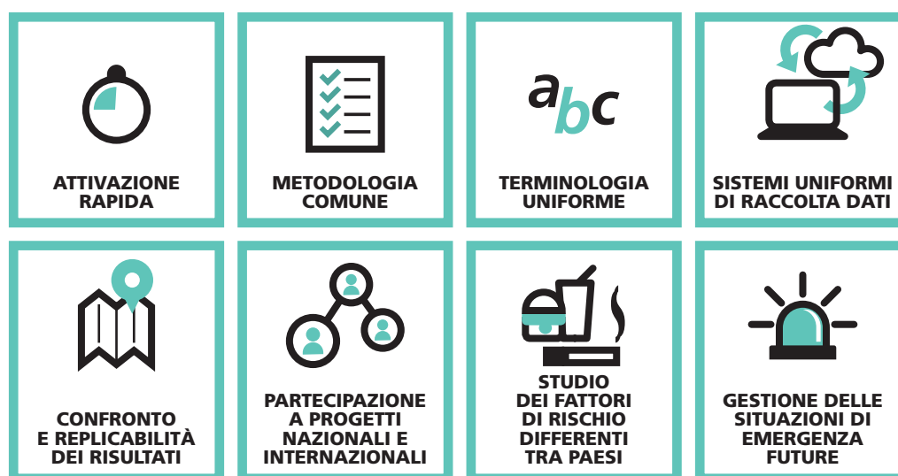
Figura 3. La preparedness della rete ItOSS.

Lo studio, ancora in corso, ha permesso di stimare i tassi di incidenza dell'infezione da SARS-CoV-2 nelle prime 146 donne che hanno partorito in Italia dal 25 febbraio al 22 aprile. La successiva analisi dell'intera coorte, che includerà anche le donne in gravidanza e in puerperio, permetterà di monitorare la qualità dell'assistenza e di valutare gli esiti delle infezioni contratte nel primo trimestre di gravidanza.