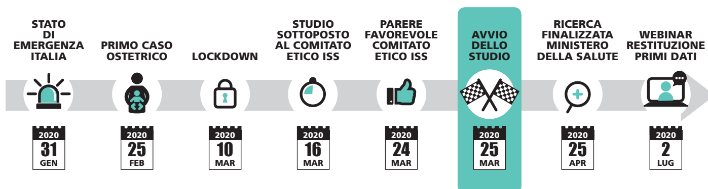
Figura 1. Cronologia del progetto. Figure 1. Timeline of the project.

Per la stima preliminare dei tassi d'incidenza sono state considerate al numeratore le donne con una diagnosi d'infezione da SARS-CoV-2 e che hanno partorito nei PN italiani tra il 25.02.2020 e il 22.04.2020 e al denominatore il numero di parti totali nello stesso periodo, stimato a partire dai dati dei Certificati di assistenza al parto (CeDAP) relativi al 2018, 20 ipotizzando una distribuzione annua uniforme e una riduzione annua delle nascite pari allo 0,3%. I tassi d'incidenza dell'infezione da SARS-CoV-2 nelle donne che partoriscono e i relativi intervalli di confidenza al 95% (IC95%) sono stati stimati a livello nazionale, per area geografica e per la Regione Lombardia.